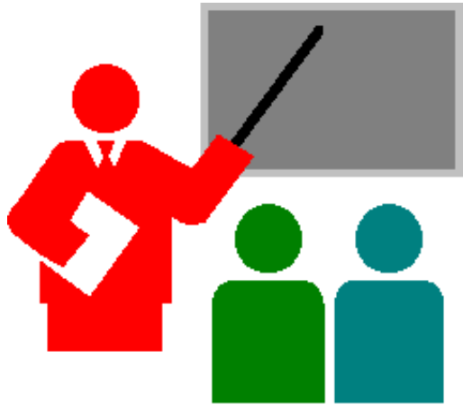
Todas la actividades académicas