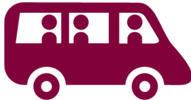
Transporte de visitas industriales